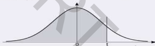
Table donnant P(Z < t) pour une variable aléatoire suivant N(0,1)